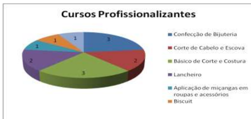
Gráfico 1: Cursos Profissionalizantes