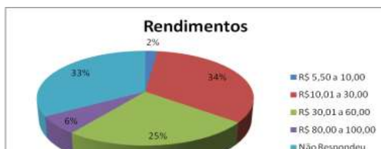
Gráfico 3: Rendimentos

Percebemos que os valores que as atividades proporcionam 33,4% das entrevistadas conseguem uma remuneração entre R$ 10,01 a R$ 30,00 e apenas 6,2% entre R$ 80,00 a R$ 100,00. Conforme tabela abaixo, averiguamos que a remuneração é insuficiente ao sustento familiar, intensificação a informalização e precarização das condições de trabalho.